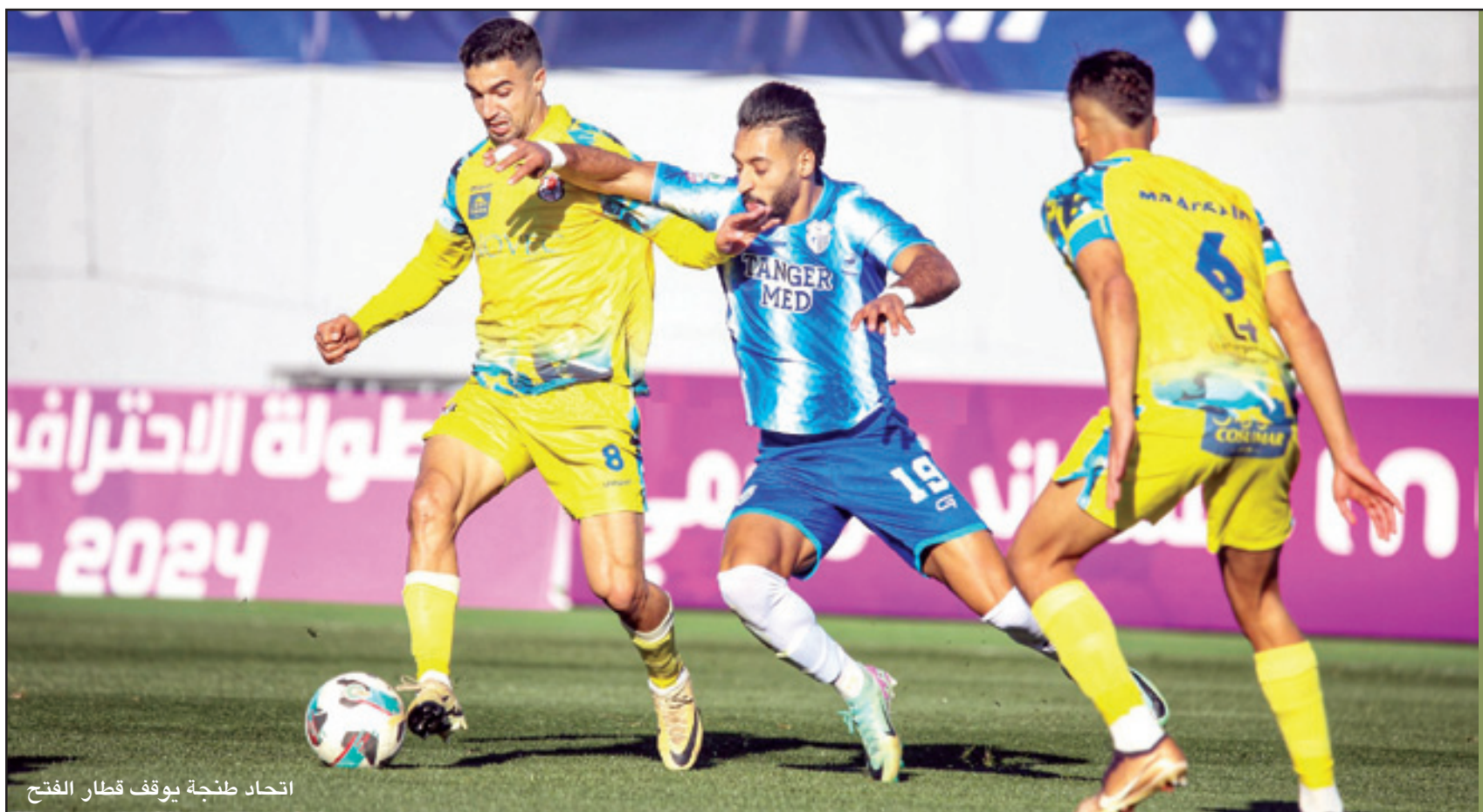
اتحاد طنجة يوقف قطار الفتح