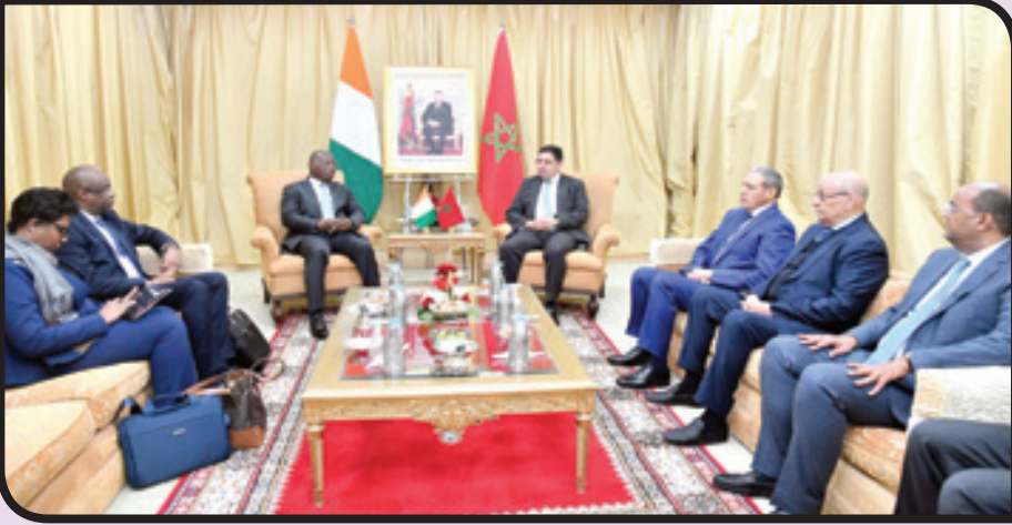
اللجنة المشتركة مع كوت ديفوار

والتعاون في إطار هذا المشروع، الذي يعد رمزا للتعاون جنوب-جنوب، وسياساهم، عند اكتماله، في تحسين ظروف عيش السكان وتعزيز التكامل الاقتصادي الإقليمي.