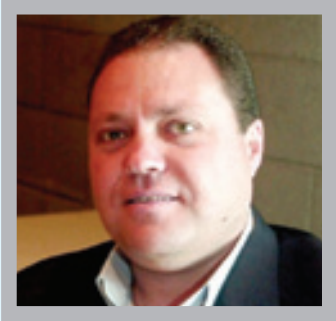
سري القدوة (*)

الشعب الفلسطيني يستقبل أخبار التهدئة ووقف إطلاق النار في قطاع غزة ويتطلع إلى إنهاء معاناته ووقف كل أشكال التشريد والتجوع والقتل والتدمير والتطهير العرقي والتهميش القسري خاصة في قطاع غزة، بفعل الوحشية الإسرائيلية المستمرة منذ 467 يوماً بشكل متواصل وسط صمت وتواطؤ دولي مخز.