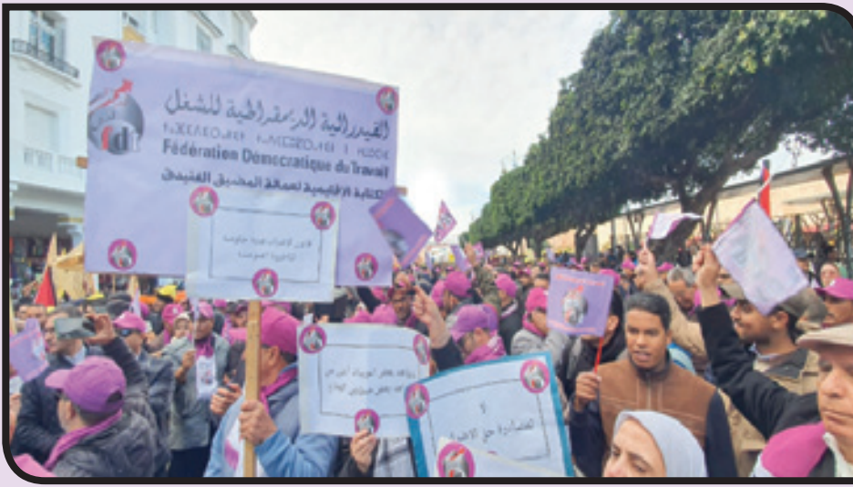
حوار جاد مع النقابات لتعديل القانون بما يضمن احترام الحقوق والعمال وتراعي المواثيق الدولية، وتحقيق التوازن بين مصالح العمال وأرباب العمل.

اختتمت المسيرة الوطنية بتأكيد المشاركين على أن هذه الخطوة ليست سوى البداية في مواجهة القوانين التي تهدد الحقوق النقابية. ودعا قادة النقابات والهيئات الحقوقية الحكومة إلى الاستجابة لمطالب الشارع، مشيرين إلى أن استمرار التنكر لهذه المطالب سيؤدي إلى تصعيد الحركات الاحتجاجية. والنقابات والأحزاب تصعد مواجهتها للحكومة بسبب قانون الإضراب، معتبرة إقراره من قبل الأغلبية البرلمانية خطوة تعكس تهيمش صوت الشغيلة وتجاهل مقترحات المعارضة الاجتماعية والسياسية. وفي شوارع الرباط شددت النقابات على أن تمرير القانون يعكس انحياز الحكومة لمصالح أرباب العمل على حساب العمال، فيما أكدت الإضراب المعارضة تضامنها الكامل مع النقابات في رفض هذا القانون، ودعت على إعادة النظر فيه من احترام حقوق الطبقة العاملة ويضمن حرية العمل النقابي. المواجهة بين الحكومة من جهة، والنقابات والأحزاب من جهة أخرى، مرشحة للتصعيد، مع تلويع الأطراف المتضررة بخطوات احتجاجية قوية قد تشمل إضرابات وطنية واعتصامات مفتوحة.