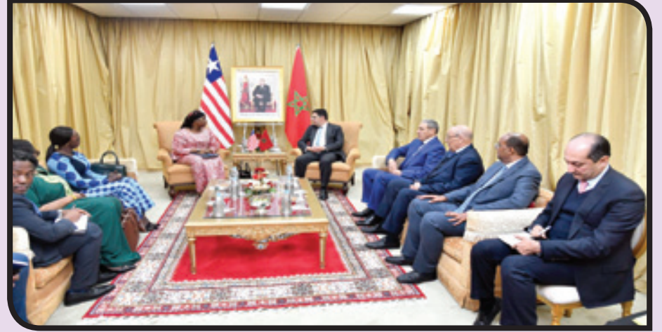
اللجنة المشتركة مع ليبيريا

كما أشاد المسؤول ذاته بالجهود التي تبذلها الأمم المتحدة كإطار حصري للتوصل إلى حل واقعي وعملي ومستدام للزراع حول الصحراء.