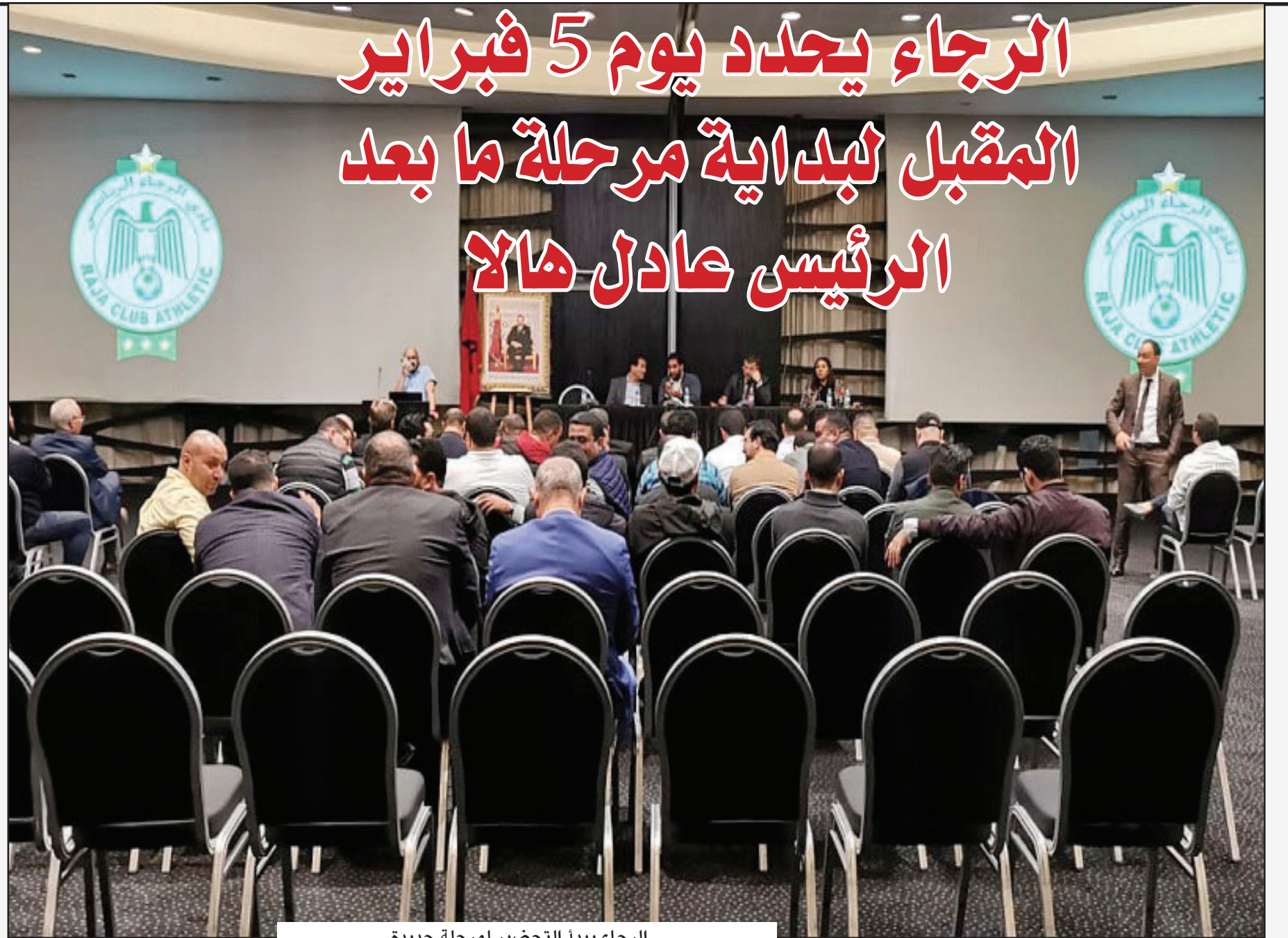
الرجاء يبدأ التحضير لمرحلة جديدة