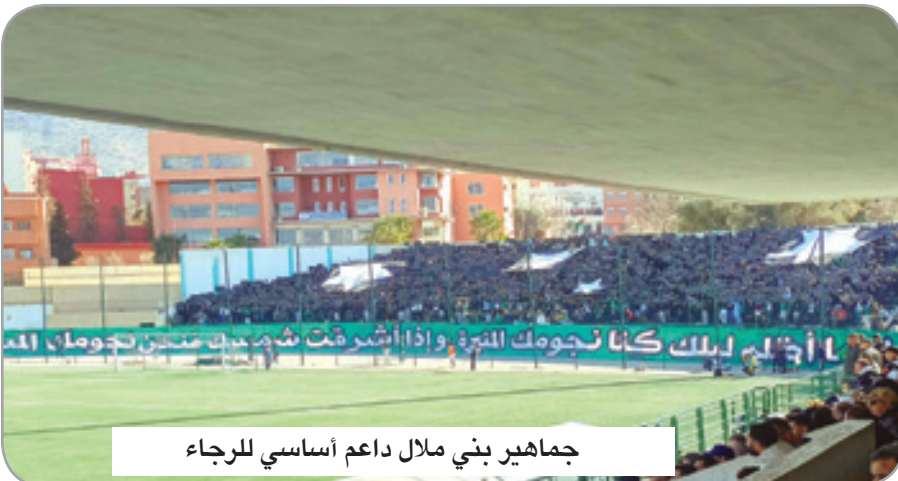
جماهير بني ملال داعم أساسي للرجاء

حول مديرية التحكم. المهم عاد الفريق الملالي إلى سكة الانتصارات، وفاز في آخر دورة لفترة الذهاب ليرفع رصيده إلى