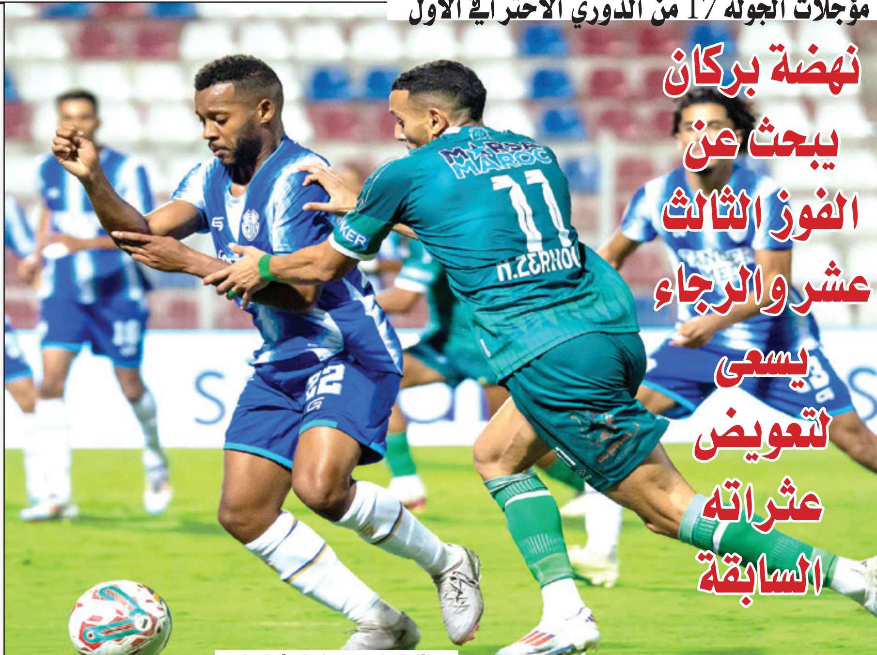
من لقاء الذهاب بين اتحاد طنجة والرجاء