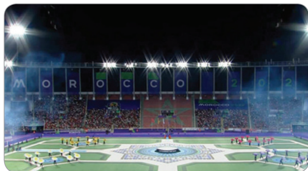
تنظيم المغرب لبطولة إفريقيا للسيدات يهجر الكاف

فإن التوقعات بخصوص احتضان المملكة لمنافسات كأس أمم إفريقيا 2025 «ستكون مرتفعة لما تمثله هذه المنافسة كاحتفال بكرة القدم الإفريقية وعرض لالتزام المغرب بالرياضة». وذكر الاتحاد الإفريقي لكرة القدم بأنه تم استقبال قرار الإعلان، يوم 27 شتنبر 2023، عن استضافة المغرب لنهائيات كأس أمم إفريقيا 2025، «بحماس واسع». وأشار إلى أن المغرب سيستضيف هذه المنافسة الكروية الأكبر في القارة الإفريقية للمرة الثانية في تاريخه، بعد دورة سنة 1988 التي شاركت فيها 8 منتخبات. وأضاف في هذا السياق أن المنافسة شهدت زيادة كبيرة في عدد المنتخبات مع مرور السنين، حيث يتنافس حاليا 24 منتخبا في النهائيات، مما يعكس نمو وتطوير كرة القدم الإفريقية على مدى العقود الثلاثة الماضية. واستعرض الاتحاد الإفريقي لكرة القدم، جانباً