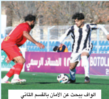
الواف يبحث عن الأمان بالقسم الثاني

خاصة وأن هناك مستحققات الضرائب والضمان الاجتماعي، التي يعمل الرئيس وأعضاء المكتب على تصفيتها. ومن جهة ثانية يحاول المكتب المسير تمكين مجموعة من اللاعبين من منحة التوقيع، حيث سيتم تقسيم اللاعبين إلى مجموعات، بهدف تخفيف الأعباء، حيث ينتظر في هذا الصدد منحة الجهة والمجلس والمقاولات. وسيعقد المكتب المسير اجتماعا مع الإطار الوطني عز الدين بوزريعة، خاصة في ظل انقسام أعضاء المكتب المديرين بين راغب في رحيله ومن يؤيد بقاءه. كما أن هناك مفاوضات مع بوناب مدرب النادي المكتاسي سابقا، وصانع عودته إلى