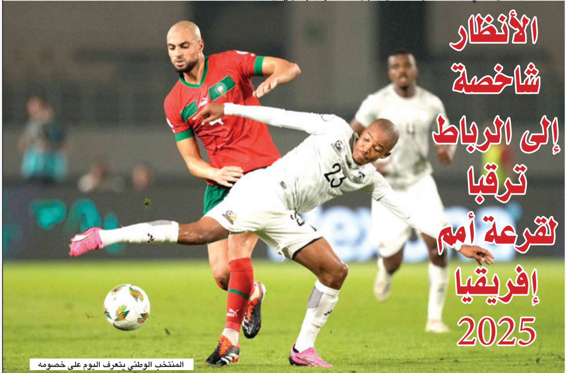
المنتخب الوطني يتعرف اليوم على خصومه