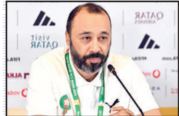
السكتيوي راضٍ عن أداء لاعبيه

وأوضح السكتيوي في المؤتمر الصحفي، الذي أعقب فوز المنتخب المغربي على نظيره القمري بثلاثة أهداف مقابل واحد، برسم الجولة الأولى من المجموعة الثانية لكأس العرب (قطر 2025)، أن «الفوز في المباراة الأولى في مثل هذه البطولات يكتسي أهمية كبيرة، لاسيما أن بطولة كأس العرب تعرف