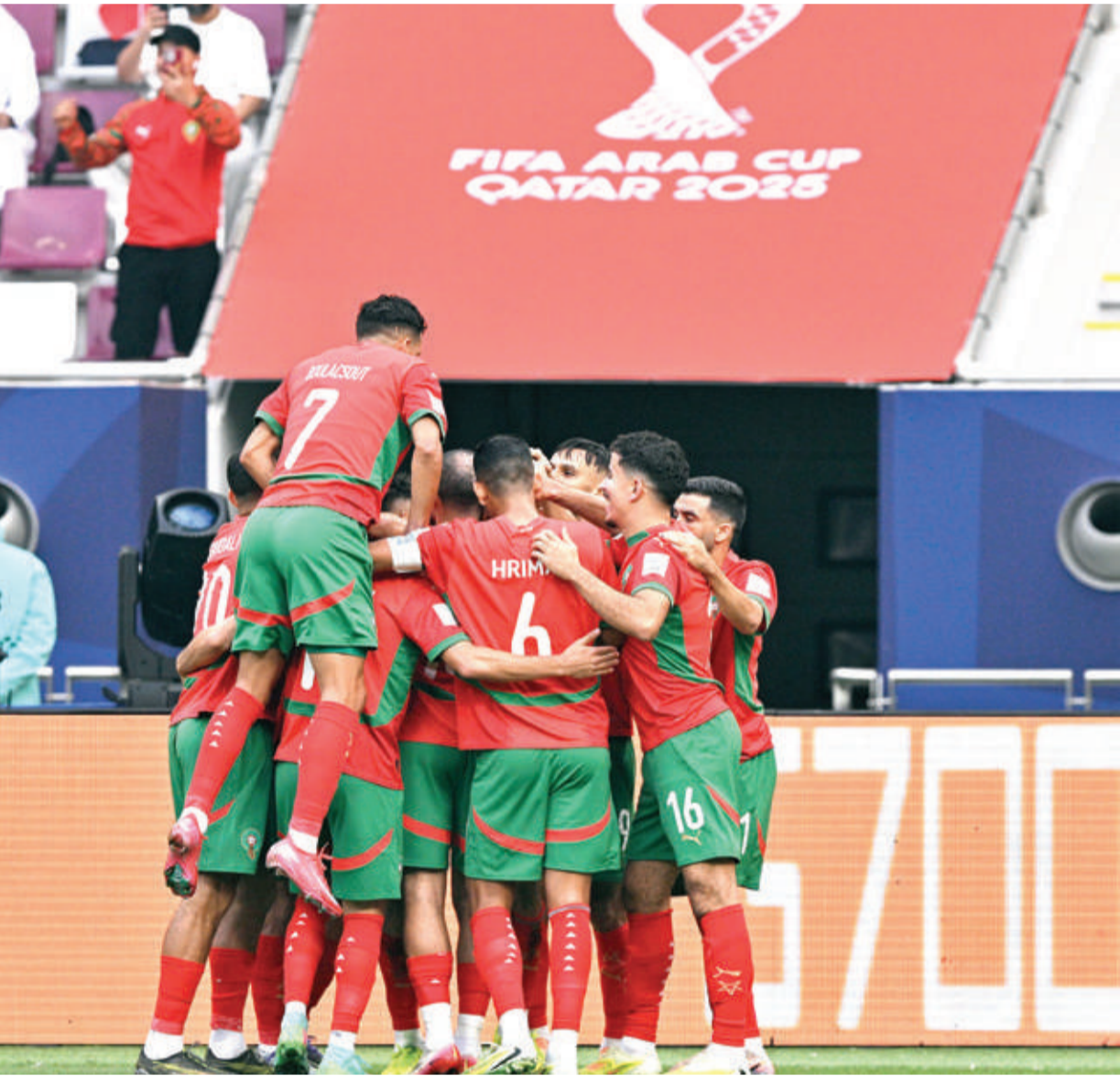
فرحة مستحقة للاعبين المغاربة

وأسفرت المباريات الترتيبية عن حصول المنتخب التونسي على المركز الثالث إثر فوزه على الجزائر (2 – 1)، بينما نال المنتخب الأردني المركز الخامس بعد انتصاره العريض على ليبيا (17 – 0).