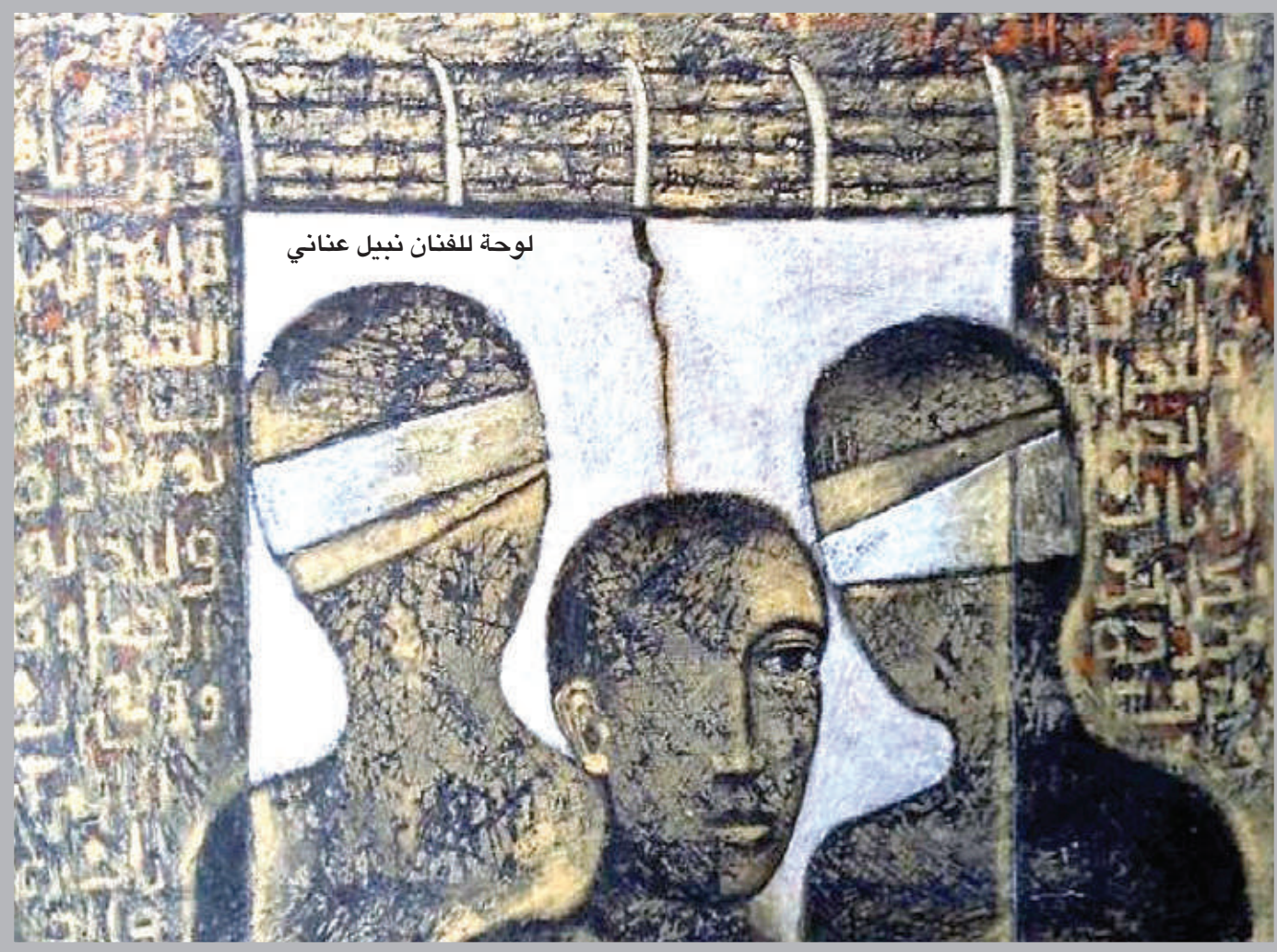
لوحة للفنان نبيل عناني

وما دام التاريخ إستوغرافيا بالتحديد كما في عبارة العروى الشهيرة، فإن تناول مبحث الذاكرة قد يُقدم إفادات مهمة في الكشف عن الجوانب الخفية والمعتمنة من التاريخ، أو ما يمكن نعتة ب «التاريخ الصامت»، ويكشف عن أماكن الذاكرة سواء كانت ذاكرة رمزية أو مادية، ويسير الانتقال من ذاكرة الأمان إلى أماكن الذاكرة، شرط ألا نتم المغالاة في ذلك على النحو الذي قد يحجب التاريخ، ويوجه النقاش نحو قضية معينة.