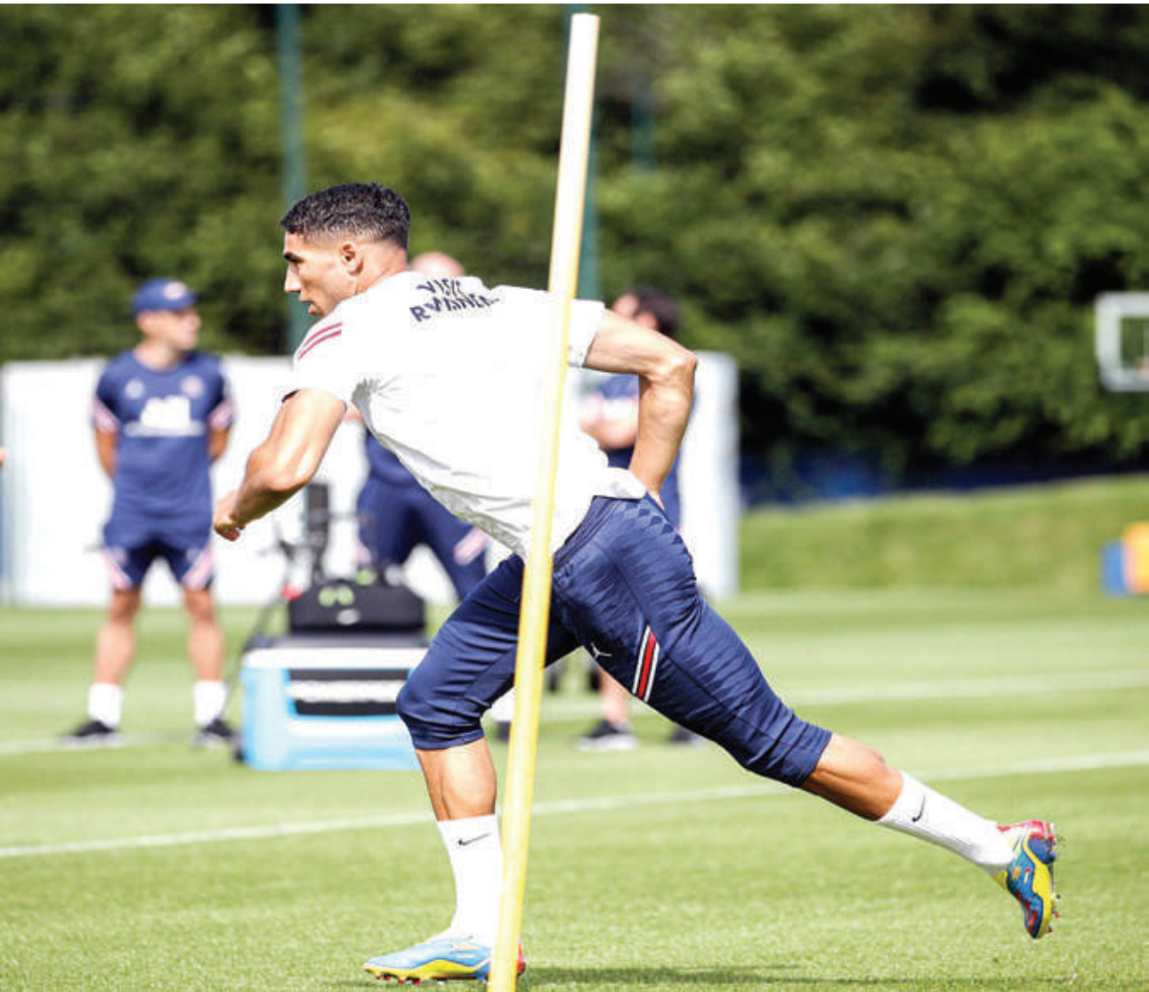
حكيمي يقترب من التعافي التام

وأضاف المصدر أن التألق المتواصل للدولي المغربي لفت اهتمام أندية إسبانية عدة، من بينها ريال بيتيس الذي يعتبر التعاقد معه أولوية خلال المرحلة المقبلة.