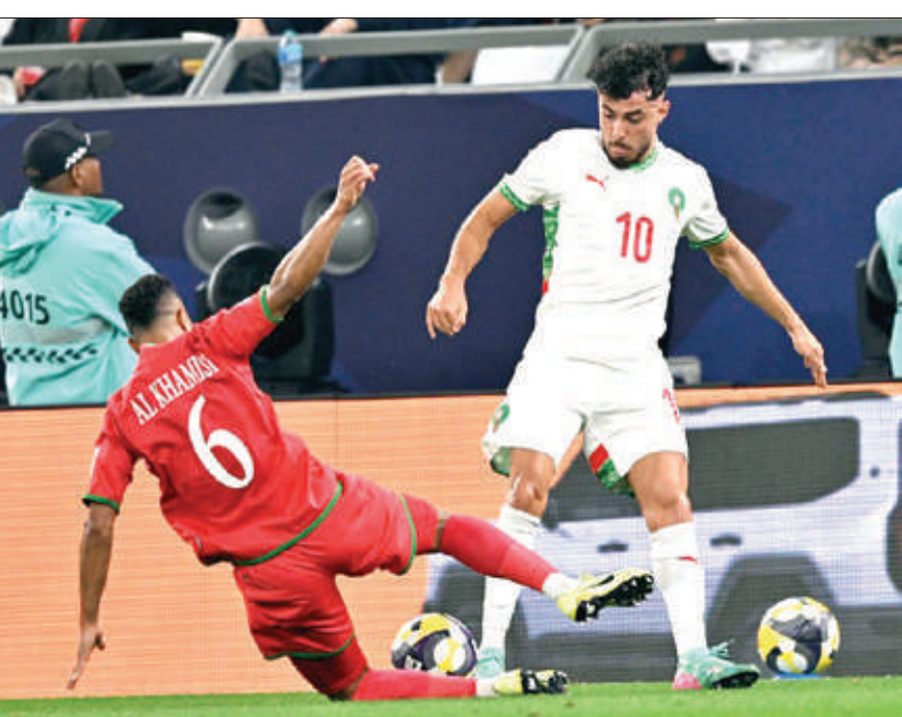
المنتخب الريدف مطالب بتقليل أخطائه أمام السعودية

وتفتتح المكسيك البطولة في 11 يونيو على ملعب «آزتيكا» بمواجهة جنوب إفريقيا، فيما يقام النهائي في 19 يوليو على ملعب «ميتلاب» بمنطقة نيويورك الكبرى. وستستضيف 16 مدينة مباريات البطولة (11 في الولايات المتحدة، 3 في المكسيك و2 في كندا).