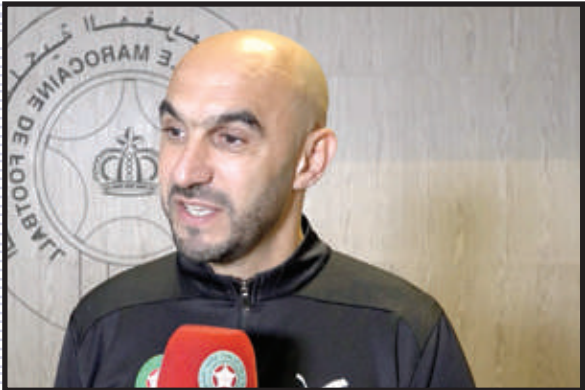
الركاكي يبرر اختياراته

المناداة عليه لتعزيز الصفوف كلما دعت الظروف ذلك». وعلى صعيد آخر، تطرق الركاكي إلى الغياب غير المعتاد للندوة الصحفية المخصصة للإعلان عن ألحة اللاعبين المندى عليهم. وقال في هذا الصدد إنه «اختيار شخصي، الأهم في هذه المرحلة هو تقديم ألحة نهائية والانتقال مباشرة إلى التجمع الإعدادي الذي سينطلق في الأيام المقبلة»، مغربا عن أمله في أن تكون الكتيبة الوطنية في مستوى تقديم مسار ناجح وتحقق التتويج باللقب القاري.