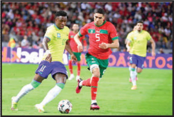
من لقاء سابق بين المغرب والبرازيل

هي كولومبيا وإنجلترا والإكوادور والبرازيل، والأرجنتين واسكتلندا وألمانيا وأستراليا وفرنسا وبنما، مسجلا أن هناك إقبالا كبيرا من جماهير أمريكا الجنوبية وأمريكا الوسطى، وكذا من مشجعي اسكتلندا المتحمسين لحضور مشاركتها الأولى في كأس العالم منذ 28 عاما. وتستمر مرحلة القرعة العشوائية حتى 13 يناير المقبل في الساعة (17:00 بتوقيت وسط أوروبا)، مع تأكيد الفيفا على أن توقيت تقديم الطلب خلال تلك الفترة لا يؤثر على حظوظ الاختيار لتلبية الطلب.