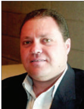
■ سري القدوة (*)

تتفاقم المسألة الإنسانية في غزة مع المنخفض الجوي العاصف الذي ضرب القطاع خلال الساعات الماضية، محولاً آلاف الخيام إلى برك من المياه تغرق فيها العائلات النازحة، وبينما يفقر الناس لأبسط مقومات الحماية والدفع، أعلنت مصادر طبية عن وفاة رضيعية ذات ثمانية أشهر نتيجة البرد القارس، وانهيار العديد من المباني المدمرة مخلفاً عدداً من الضحايا في مشهد يجسد حجم الكارثة. وما يواجهه سكان قطاع غزة يعكس خطورة الأوضاع الإنسانية خاصة على الأطفال والنازحين، الذين يعيشون في خيام ضعيفة وغير مؤهلة لمواجهة الطقس البارد، ويعاني أهالي قطاع غزة من انعدام المأوى والعلاج، وعدم وجود وسائل التدفئة في ظل منخفض جوي عاصف وبارد وماطر، ولا بشكل المنخفض الجوي خطراً على النازحين في الخيام فقط، بل أيضاً على عشرات آلاف الأسر التي تقطن في بيوت متضررة وأتلة للانهيار بسبب القصف الإسرائيلي خلال العدوان. وتمنع قوات الاحتلال عشرات آلاف العائلات من العودة إلى بيوتها وراء ما يعرف بـ"الخط الأصفر" بل وتواصل تدميرها رغم اتفاق وقف إطلاق النار، و يعيش سكان القطاع (2,3 مليون نسمة) أوضاعاً إنسانية قاسية سواء على صعيد الأمن أو السكن أو الغذاء، ويعاني النازحون من اهتراء الخيام بعد مرور عامين من استخدامها أو قلة عددها بسبب قبود الاحتلال على دخولها، بينما يقطن زهاء 300 ألف عائلة في خيام منتشرة في طرقات وأحياء مدن ومخيمات النزوح في مناطق تقع داخل ما يسمى بالخط الأصفر بقطاع غزة.