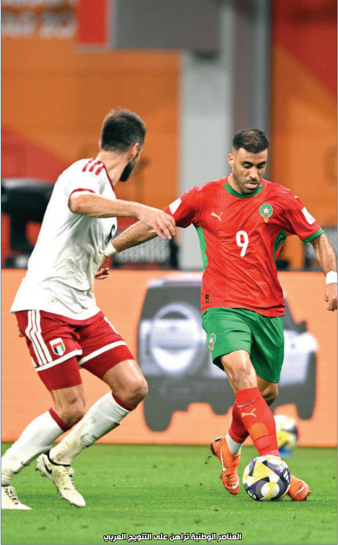
العناصر الوطنية تراهن على التتويج العربي

ويخوض السكتيوي التجربة الثالثة مع منتخب مغربي مختلف، إذ كانت البداية مع المنتخب الأولبي الذي شارك في دورة أولمبياد 2024، ثم منتخب المحليين الذي شارك في بطولة إفريقيا منذ أشهر قليلة، فالمنتخب الريدف الذي يشارك في كأس العرب المقامة حاليا في قطر، وخلال هذه