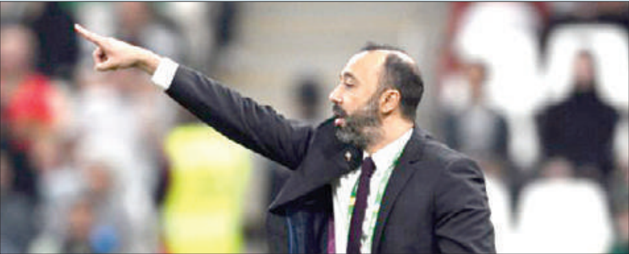
السكتيوي يتطلع إلى لقب جديد