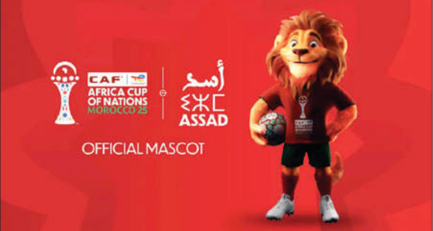
تميمة بطولة إفريقيا بالمغرب

وقال «بالنسبة لي، كل المؤشرات تدل على ذلك. لم يسبق لنا إجراء مباريات كأس إفريقيا للأمم في تسعة ملاعب، مبرزًا أن الإقبال الشعبي على هذه المسابقة